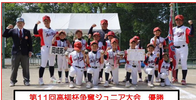
第11回高柳杯争奪ジュニア大会 優勝