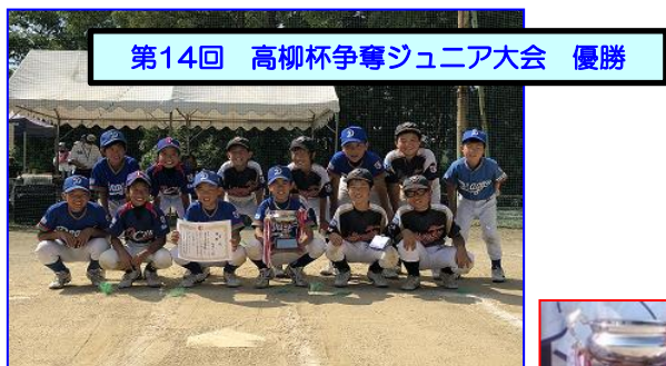
第14回 高柳杯争奪ジュニア大会 優勝