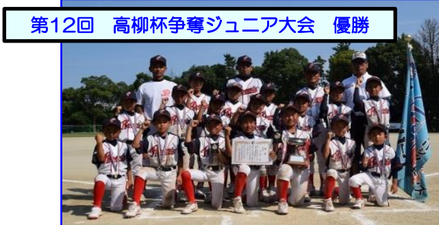
第12回 高柳杯争奪ジュニア大会 優勝