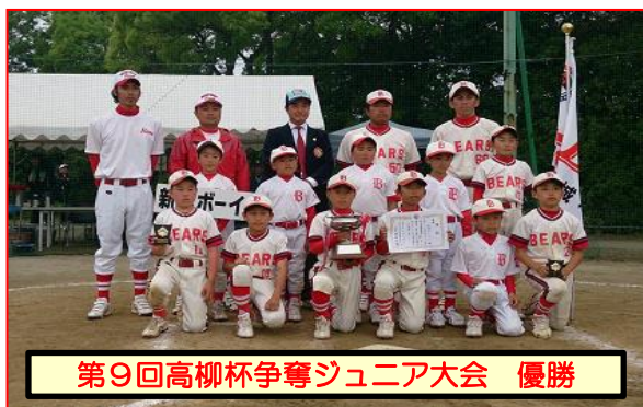
第9回高柳杯争奪ジュニア大会 優勝