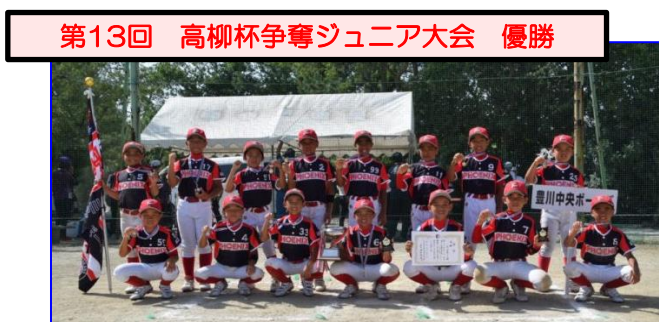
第13回 高柳杯争奪ジュニア大会 優勝